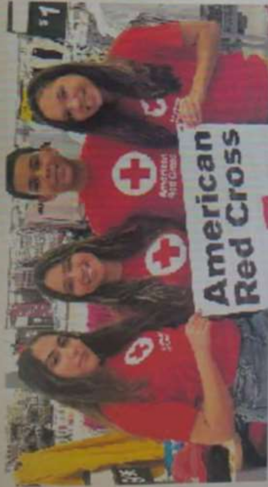
CONSEJO JUVENIL DE LA CRUZ ROJA DE LA ESCUELA SAN GERMÁN INTERAMERICANA, QUIENES APOYAN LA RECAUDACIÓN DE FONDOS PARA LA CRUZ ROJA AMERICANA EN PUERTO RICO

Este fin de semana tuvimos un grupo del consejo juvenil de la Escuela San Germán Interamericana que apoyaron la campaña de recaudación de fondos que tenemos activa. Los consejos juveniles realizan una labor extraordinaria para ayudarnos con diferentes esfuerzos y una de las iniciativas tiene que ver con nuestras campañas de recaudación de fondos.