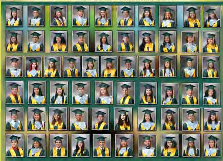
Escuela San Germán Interamericana CLASE 2020-2021 Duodécimo Grado