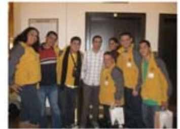
NCSL Washington, DC Noviembre 2009