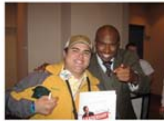
NCSL Orlando, Florida Noviembre 2008