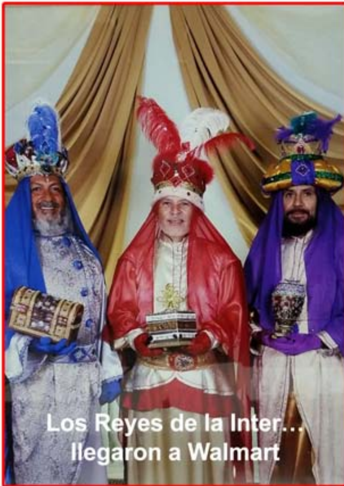
Por: Leticia Martínez Oficial de Desarrollo

La Navidad es una época especial, donde celebramos el nacimiento del niño Jesús y marca una tradición que en nuestra Isla se celebra con mucha alegría y fervor religioso. En la Inter, Recinto de San Germán, lo celebramos de igual forma; con el encendido de navidad, posada, misa de aguinaldo, fiesta navideña y los Reyes Magos. Ponemos pasión en todas estas celebraciones y nuestros Reyes son esperados por nuestra comunidad y en varios pueblos que nos solicitan su presencia, por la hermosa representación que realizan, lo vistoso de sus trajes y el trato hacia los niños. Son muchas las personas, niños y adultos, que solicitan tomarse una foto con ellos. Razón por la cual nuestros Reyes Magos visitaron el jueves, 4 y el viernes, 5 de enero de 2018 en el horario de 9:00 – 5:00 pm y el de 9:00 – 3:00pm la tienda de Walmart en Mayagüez Mall. Fueron muchos los clientes, niños y adultos que con mucha alegría y emoción quisieron tomarse una foto con ellos, por un donativo de 5.00 dólares, aportando de esta forma al fondo de becas para estudiantes talentosos de escasos recursos de nuestro Recinto.