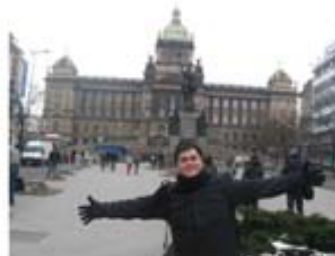
International Youth Leadership Conference Praga, República Checa (Enero 2011)