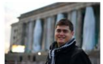
Fundación Ortega y Gasset (Intercambio de Verano 2011) Buenos Aires, Argentina