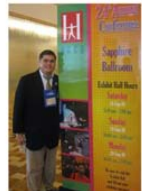
HACU Student Track Conference San Diego, CA EEUU (2010)