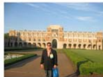
RICE University, Houston TX EEUU (2010)