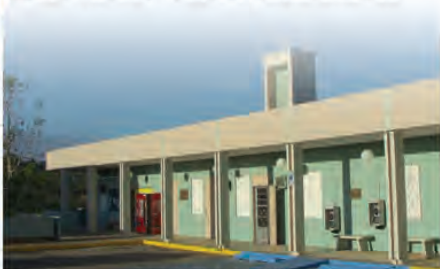
Edificio Dr. Ismael Vélez

Maestría en Contabilidad y en Sistemas de Información Gerencial