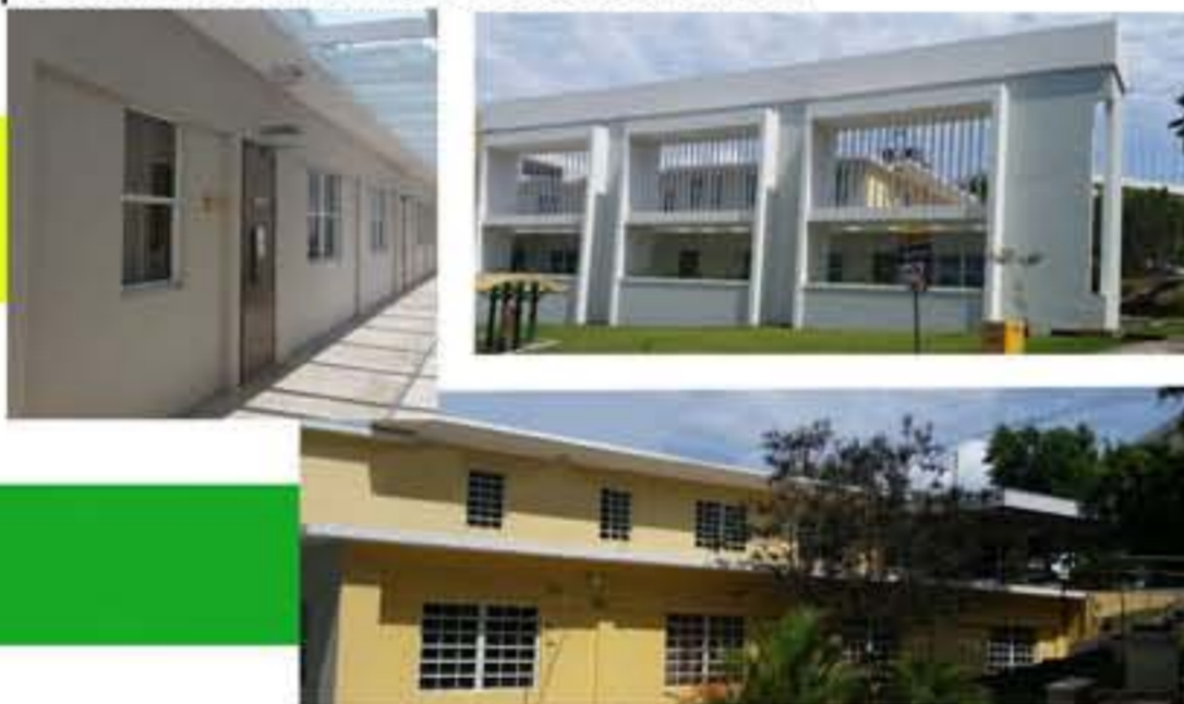
EDIFICIO EUSEBIO LOPEZ ACOSTA

El Programa de Tecnología Radiológica ofrece el Grado de Asociado en Ciencias Aplicadas desde 1985 y tiene una duración de dos años y medio. El Grado de Bachillerato en Ciencias Radiológicas se ofrece desde el 2008 con un currículo cuya duración es de un año a un año y medio. Fue creado para preparar tecnólogos radiológicos, los que constituyen los profesionales de la salud responsables por la ejecutoria de procedimientos radiográficos mediante el uso de equipos de radiología diagnóstica. La misión del Programa es preparar profesionales en la creación de imágenes médicas utilizando los Rayos X, Tomografía Computadorizada y Resonancia Magnética para agilizar y precisar el diagnóstico y tratamiento de enfermedades. Estos profesionales trabajan en colaboración con Radiólogos y otros especialistas en diversos escenarios.