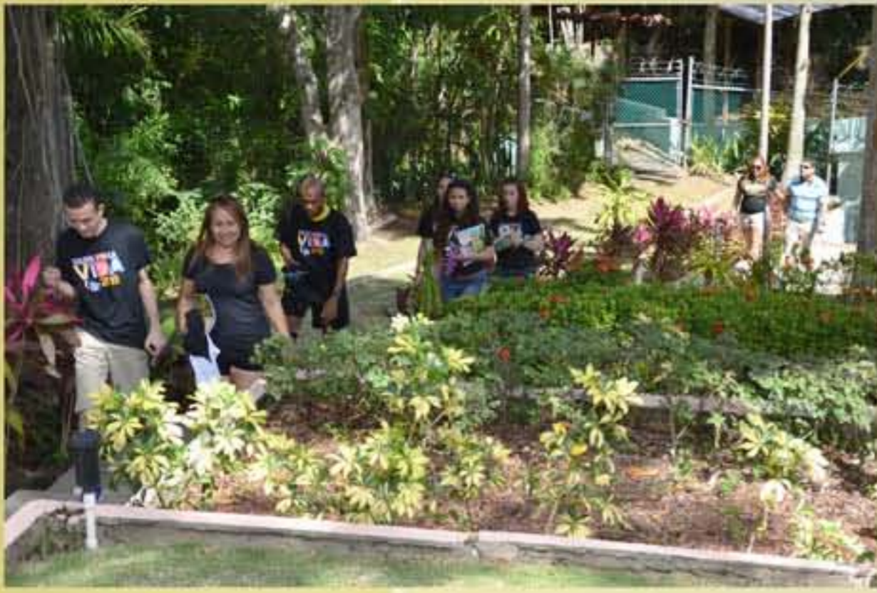
Visita a Casa María