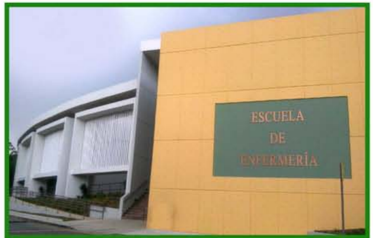
ESCUELA DE ENFERMERÍA

En la planta baja del edificio, para los años 80, estuvieron ubicadas las oficinas de Registraduría y Recaudaciones. Luego, albergó el Departamento de Ciencias Aliadas de la Salud desde el año 1999 hasta el 2015. En 2015 fue remodelado y actualmente, en estas facilidades se mantienen los programas de Tecnología Médica y Tecnología Radiológica.