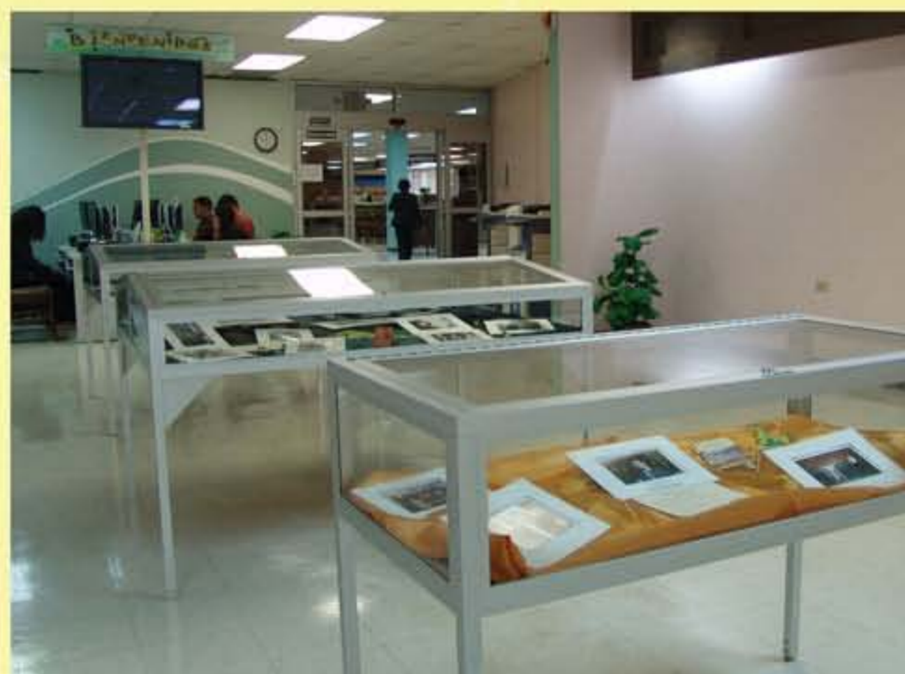
Exposición Histórica del 103 Aniversario en el Centro de Acceso a la Información