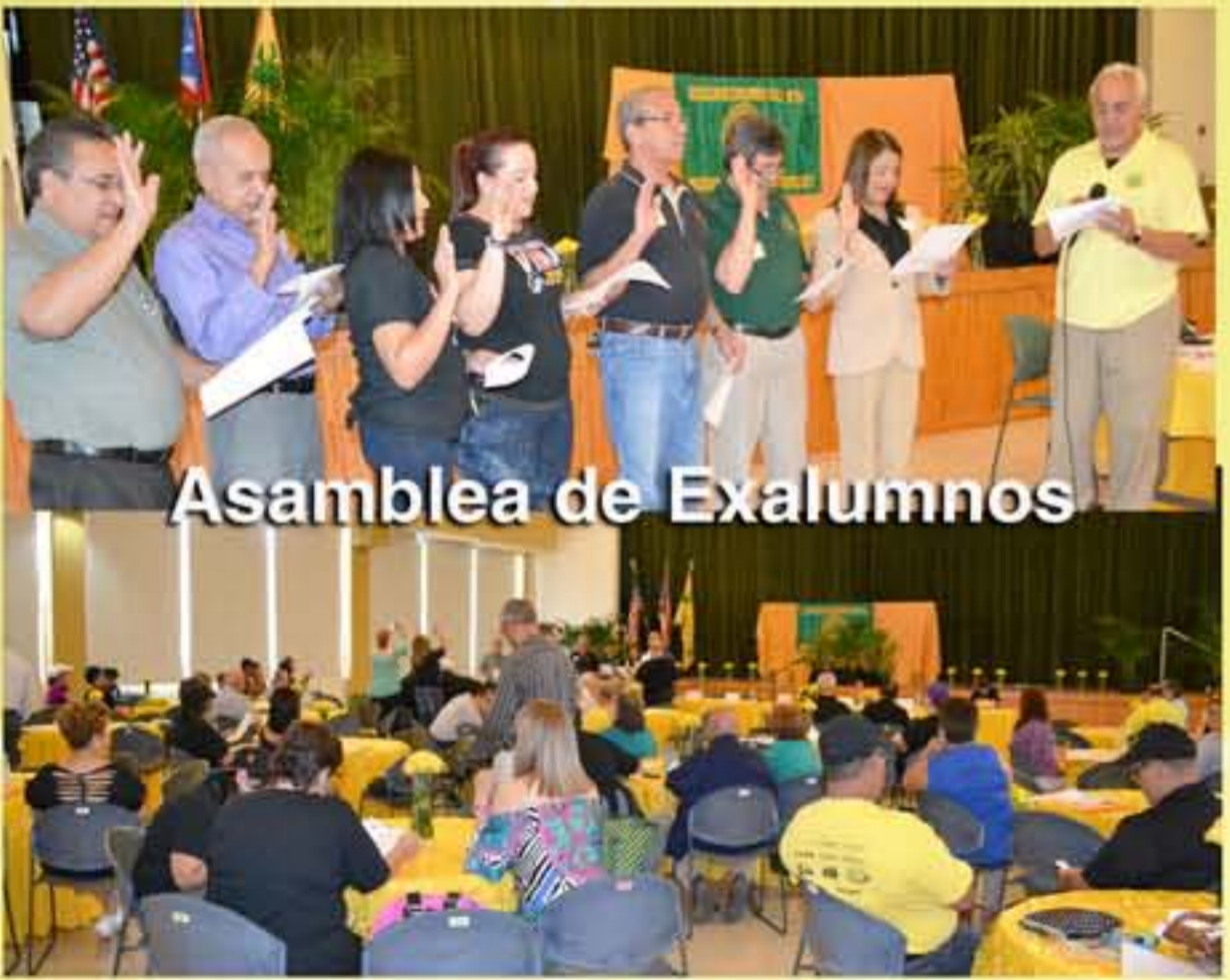
Asamblea de Exalumnos